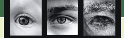
Comenius • Erasmus • Leonardo da Vinci • Grundtvig