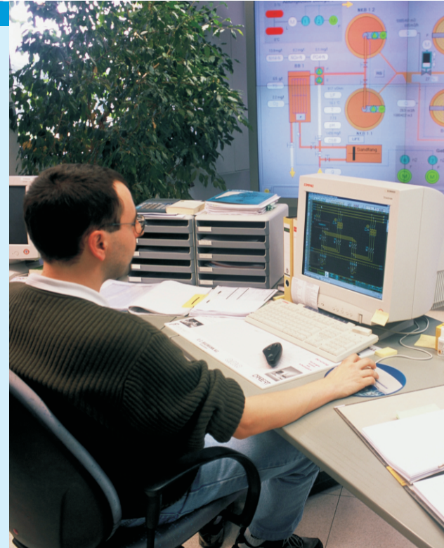
Leonardo da Vinci Programı

Merkezi faaliyetlerde başvuru seçim ve sözleşmelerle ilgili süreçlerin tamamı Eğitim ve Kültür Genel Müdürlüğüne bağlı olarak çalışan Eğitim, İşitsel Görsel Medya ve Kültür Yürütme Ajansı tarafından yürütülür (The Education, Audiovisual and Culture Agency Executive Agency) (EACEA). Genel kural olarak projeye dahil ortaklardan biri koordinatör olarak görev yapar ve Komisyona karşı projeden sorumludur. ( http://eacea.ec.europa.eu )