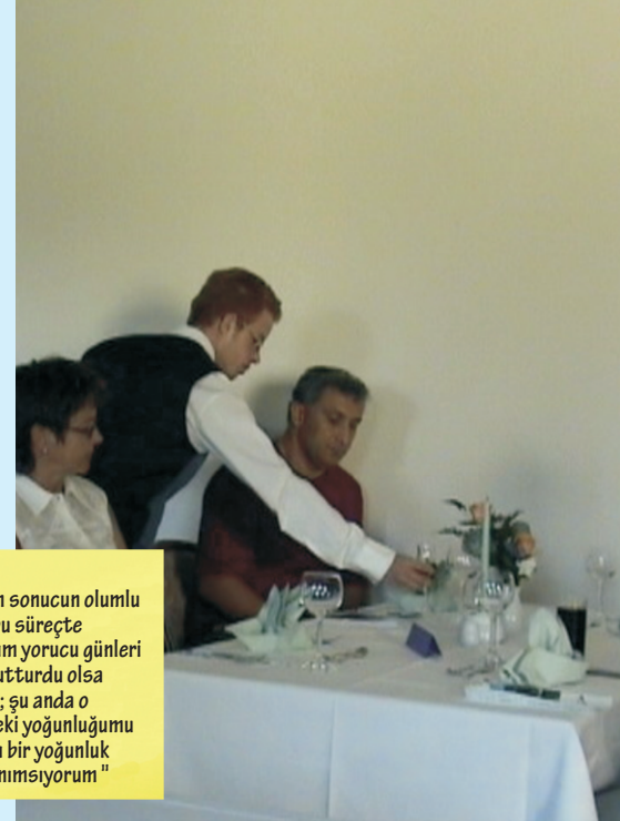
Leonardo da Vinci Programı

"Sanırım sonucun olumlu olması bu süreçte yaşadığım yorucu günleri bana unutturdu olsa gerek ki ; şu anda o günlerdeki yoğunluğumu çok tatlı bir yoğunluk olarak anımsıyorum "