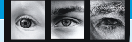
Comenius • Erasmus • Leonardo da Vinci • Grundtvig