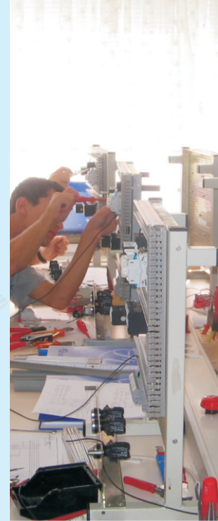
Leonardo da Vinci Programı

"Proje hedeflerine ulaşmak için yoğun kültürel ve teknolojik işbirlikleri yapılıyor, yeni dostluklar kuruluyordu."