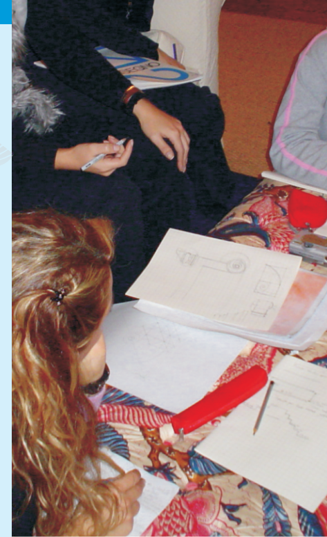
Leonardo da Vinci Programı

" Bu proje neticesinde yarımlara dair umudumuz arttı. Bu tecrübeyi yaşayan bizim gibi gençlerin ülke yönetiminde ve kültürel yapımızda büyük işler başaracağına dair inancımız pekişti."