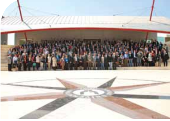
Tüm katılımcılarla birlikte

Yükseköğretim kurumlarının Erasmus Koordinatörlükleri ile her yıl bahar ve güz dönemlerinde olmak üzere yılda iki kez düzenlenen toplantılardan 2010 yılı Erasmus Bahar Toplantısı, 8-9 Nisan 2010 tarihlerinde Ege Üniversitesi ve Yaşar Üniversitesi'nin evsahipliğinde İzmir'de gerçekleştirilmiştir. 117 yükseköğretim kurumundan 300'den fazla temsilcinin katıldığı toplantıda Erasmus programının dönemselsel olarak değerlendirilmesinin yanı sıra yükseköğretim kurumlarına yeni dönem ile ilgili gelişmeler aktarılmış, iyi uygulama örneklerine değinilmiş, tecrübeler paylaşılmış ve Erasmus programının işleyişiyile ilgili karşılıklı görüş alışverişi sağlanmıştır.