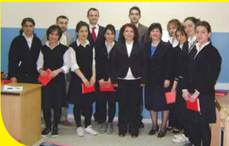
Proje katılımcıları, öğretmenleri ve idarecileri ile birlikte

Ulusal Ajans projelerinin izlenmesi konusunda çok güzel bir ilerleme kaydetmiştir. Kontroller için Ulusal Ajans bilgisayar destekli bir seçim sistemi belirlemiş olup bunu alanında iyi uygulama olarak değerlendirebiliriz.