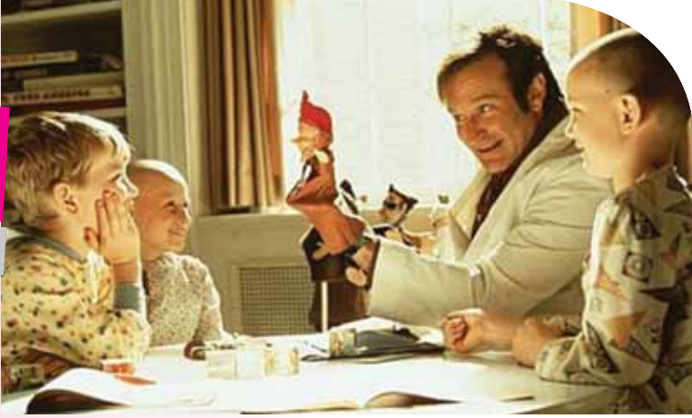
Patch Adams Filminden bir sahne