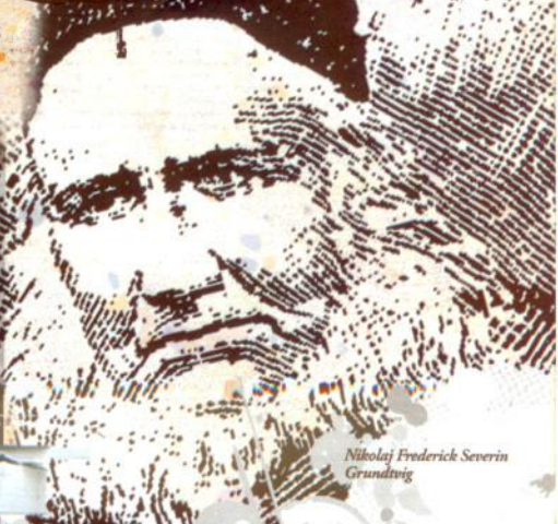
Nikolaj Frederick Severin Grundtvig