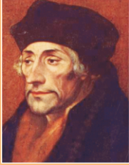
Desiderius Erasmus (1465 - 1536)

Yılları arasında yaşamış Hollandalı bir felsefe adamıdır. Rönesans'la birlikte ortaya çıkan hümanizm akımının öncülerinden ve en büyük temsilcilerinden biri olan Erasmus, Avrupa'nın ortak bir sanat ve bilim çatısı altında birleşmesine yaptığı katkılardan dolayı ve çağının eğitim felsefesine olan etkisi ile programa uygun bir isim olarak düşünülmüştür.