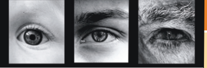
Comenius • Erasmus • Leonardo da Vinci • Grundtvig